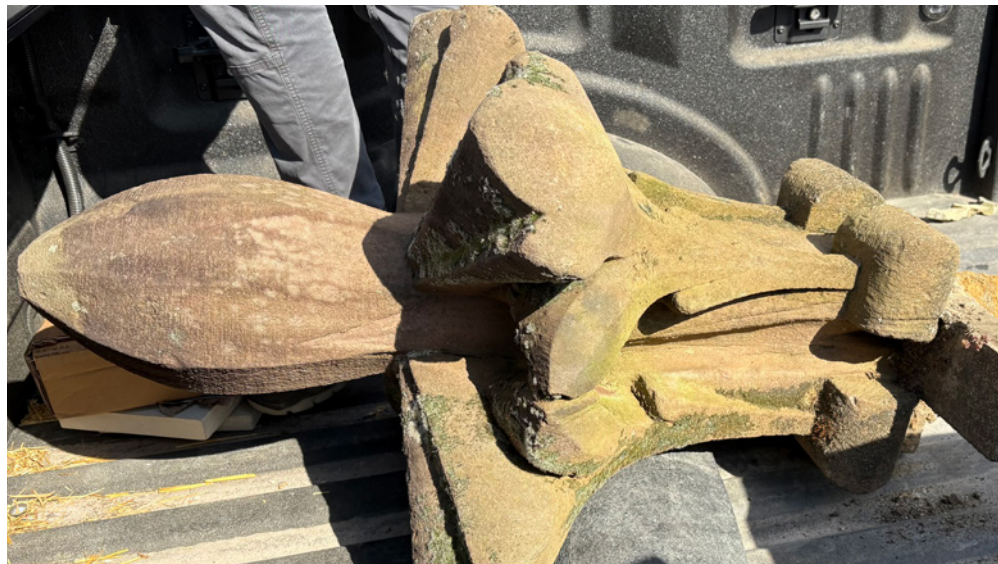
Eine Kreuzblume der alten Annakirche.