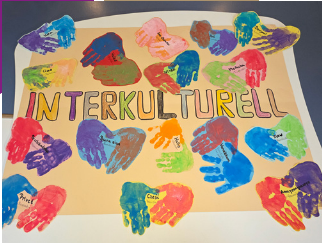
Türen öffnen heißt auch Herzen öffnen: Kunstwerke der Kinder und Erziehenden der Kindertagesstätten San Pedro (oben), St. Anna (unten) und St. Bonifatius (rechts).

Die offene Türe wird zum Sinnbild für unsere Herzen. Wenn wir eine Tür öffnen, treten Menschen, Kinder und Erwachsene ein. Sie kommen zu uns ins Haus und sind herzlich willkommen. Diese Gastfreundschaft spüren sie an ganz unterschiedlichen Stellen, aber immer an der Herzlichkeit in der Begegnung. Diese Qualität von Offenheit und Gastfreundschaft erwächst in unseren Kitas aus christlicher Überzeugung. So wie das Kind damals ist auch heute jedes Kind einmalig und wunderbar. Jedes Kind verdient einen eigenen Schutz- und Entwicklungsraum. Gott liebt jedes Kind, jeden Menschen „unbedingt“, also ohne Vorleistung.