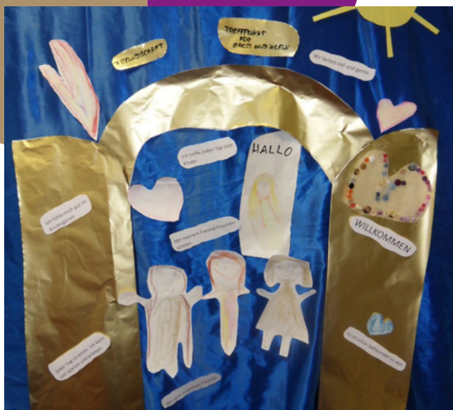
Offene Türen: kreativ umgesetzt durch Kinder und Erziehende der Kindertagesstätten St. Josef (oben) St. Marien (unten).