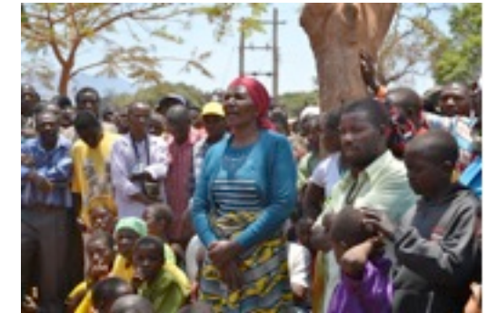
Dorfversammlung in Mavanga während unseres Aufenthaltes dort.

Die zweite Bauphase der Kindertagesstätte und Vorschule in unserer Partnergemeinde St. Marien in Mavanga wurde aufgrund von besonders großen Niederschlagsmengen erst einmal gestoppt. Die Arbeiter sind zurzeit auf ihren Feldern, um auszusäen.