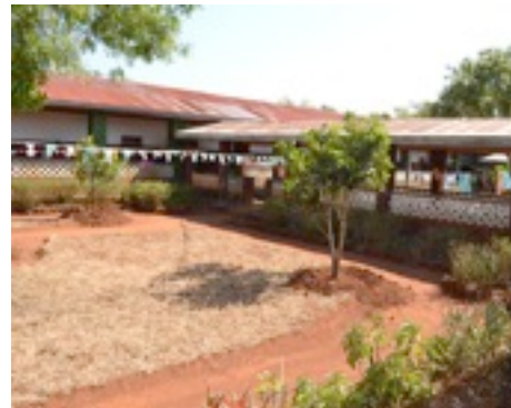
Das Medical Center von Mavanga wird von uns seit Jahren unterstützt.