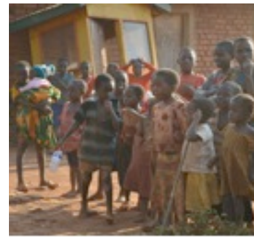
Diese Kinder konnten bisher nicht in eine Vorschule gehen.