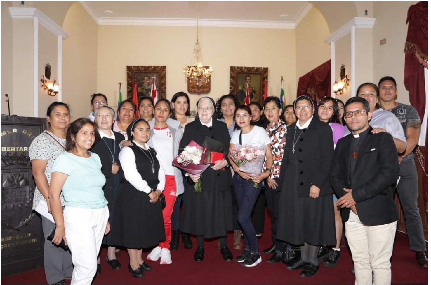
Stolz präsentiert sich die Abordnung des Kinderheims nach der Ehrung durch den Stadtrat von Sucre.