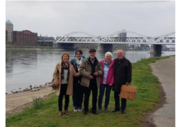
Traditionelles Austausch-Treffen in Mannheim mit Vertretern des Missionskreises der Pfarrei St. Maria Himmelfahrt, Ulm-Söflingen, die ebenfalls Mavanga unterstützen.

Wir wünschen Ihnen und Ihren Familien eine gesegnete Karwoche und ein frohes Osterfest!