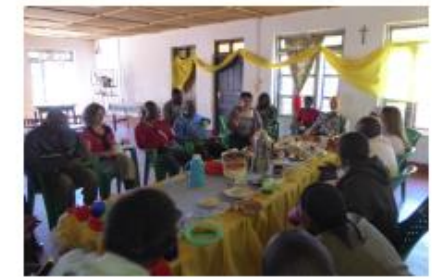
Treffen mit verantwortlichen Dorfbewohnern

In der Mitgliederversammlung wurde die Freigabe von Geldern für eine Reihe von Projekten in Mavanga beschlossen: